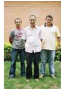
Gerência do PAD-DF