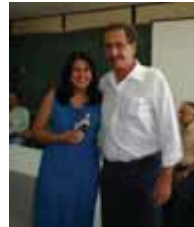
Coordenadoria de Planejamento