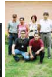
Gerência do Gama