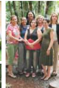
Gerência de Pessoal