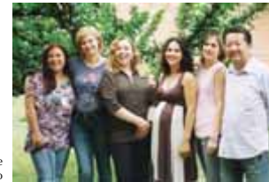
Gerência de Programação e Orçamento