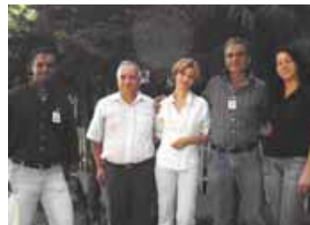
Coordenadoria de Operações