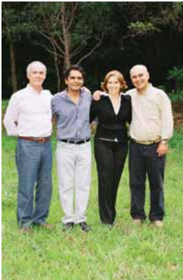
Presidência e Diretoria-Executiva Pioneiros