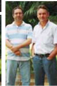
Gerência de Contabilidade