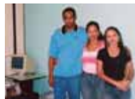
Associação dos Servidores - ASSER