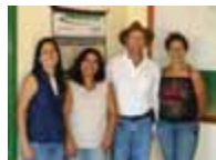
Gerência de Vargem Bonita