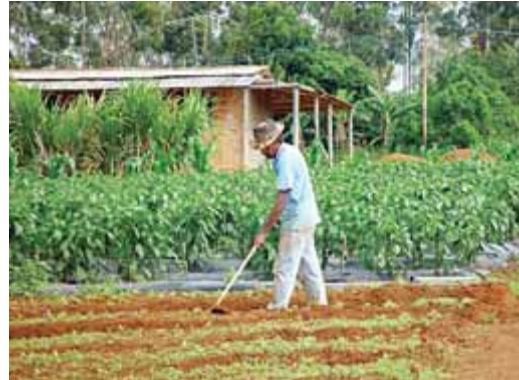
BRASÍLIA, DF 2008