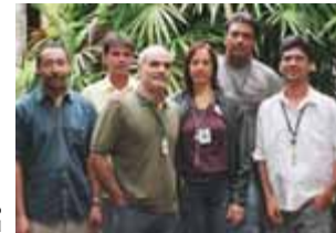
Gerência de Acompanhamento Operacional