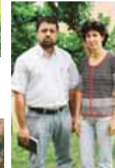
Gerência de Regional Oeste