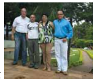
Gerência de Execução Orçamentária e Financeira