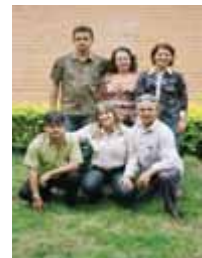
Gerência de Ceilândia