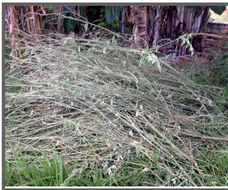
Figura 34 - Talos após a remoção das folhas