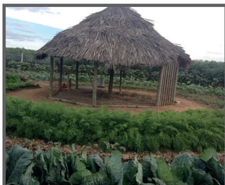
Figura 63 - Sistema "mandala" circular