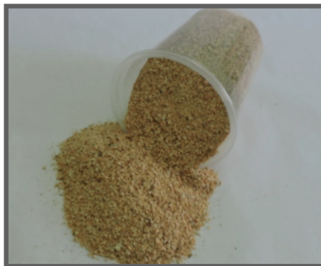
Figura 14 - Farelo de soja - principal fonte de proteína na dieta de aves