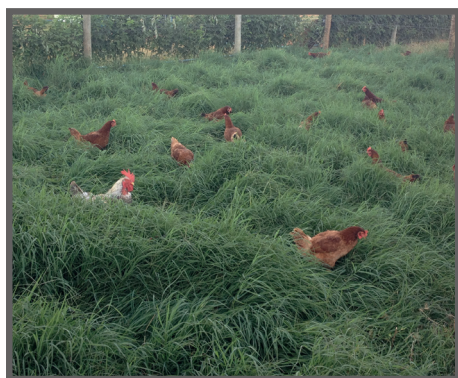
Figura 3 - Pastagens para aves

Alimentos volumosos: São aqueles que, em sua composição, apresentam teores de fibra bruta superiores a 18% e/ou menos de 60% de nutrientes digestíveis totais (NDT). Exemplos: pastagens (figura 3), silagens (figura 4), cana-de-açúcar, feno (figuras 5 e 6).