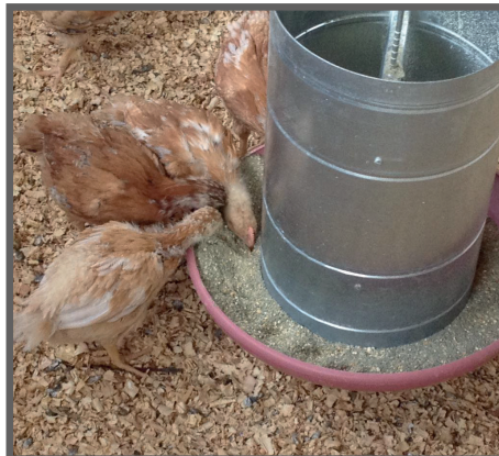
Figura 38 - Aves se alimentando da ração