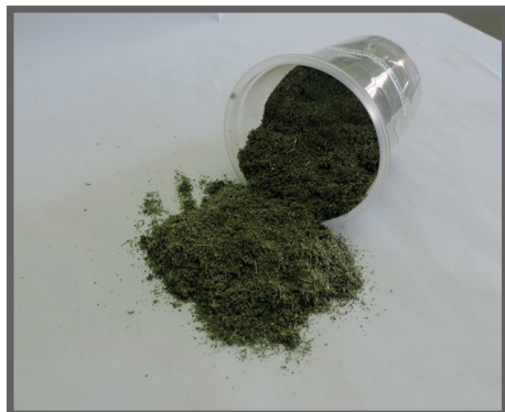
Figura 5 - Feno da folha de feijão Guandú