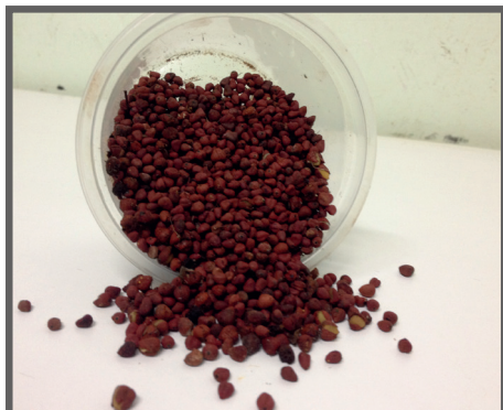
Figura 71 - Sementes de urucum