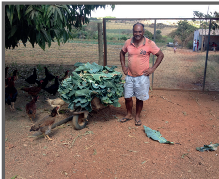
Figura 62 - Resto da lavoura de brócolis