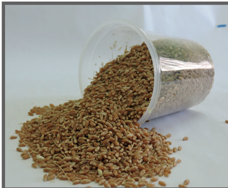
Figura 8 - Trigo em grãos