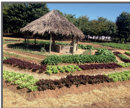
Figura 64 - Sistema "mandala" hexagonal

Folhas e tronco de bananeira: É utilizado principalmente com a função de combater verminoses e diarreias, em virtude dos teores de tanino. O fornecimento é feito in natura , colocando as folhas ou o tronco da bananeira a disposição das aves (figuras 65 e 66).