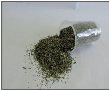
Figura 6 - Feno da parte aérea da mandioca