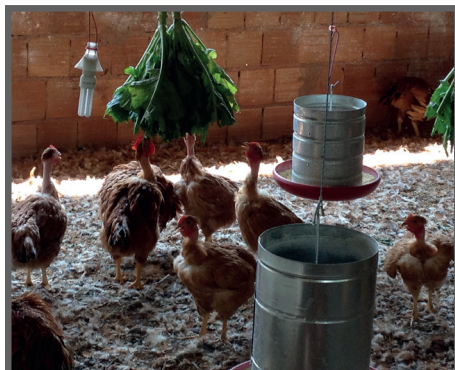
Figura 61 - Aves se alimentando de couve