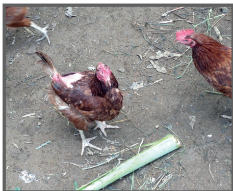
Figura 73 - Ave sem penas no dorso

Deficiência nutricional: Dietas balanceadas de forma inadequada é a causa mais recorrente de canibalismo, seja por deficiência proteica, mineral ou de vitaminas. Sendo assim, o produtor deve estar sempre atento e fornecer uma ração que atenda as exigências nutricionais da ave para cada fase do ciclo de produção.