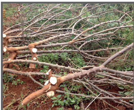
Figura 21 - Manivas (não devem ser utilizadas)