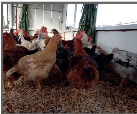
Figura 58 - Capineira pendurada no galpão