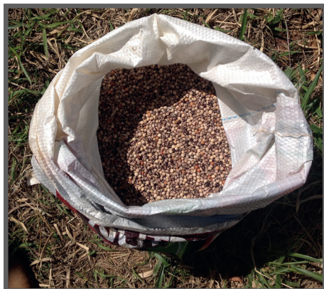
Figura 29 - Feijão Guandu em grãos