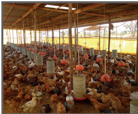
Figura 2 - Distribuição dos bebedouros pelo galpão