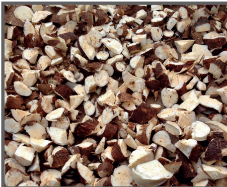
Figura 24 - Mandioca cortada em raspas