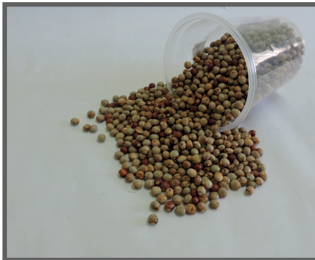
Figura 12 - Feijão Guandu em grãos