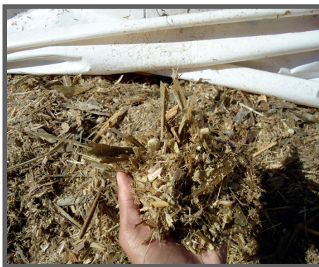
Figura 4 - Silagem de capineira