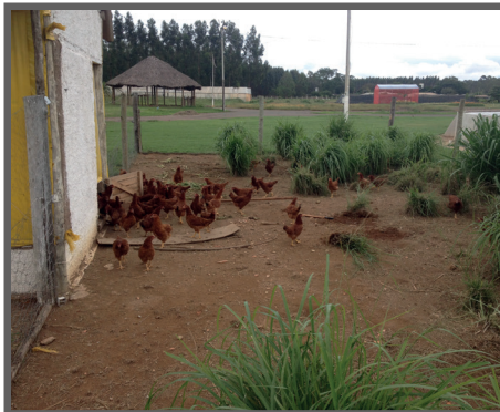
Figura 54 - Crescimento por touceiras (massai)