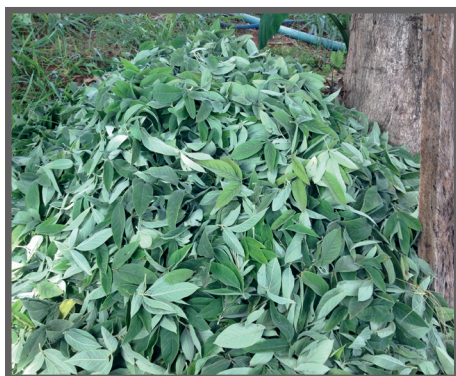
Figura 33 - Folhas de feijão Guandu