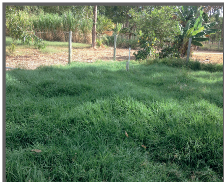
Figura 51 - Piquete com 20 dias de repouso