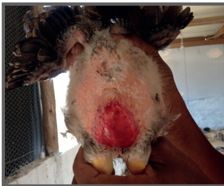
Figura 74 - Ave com ferimento abaixo da cloaca