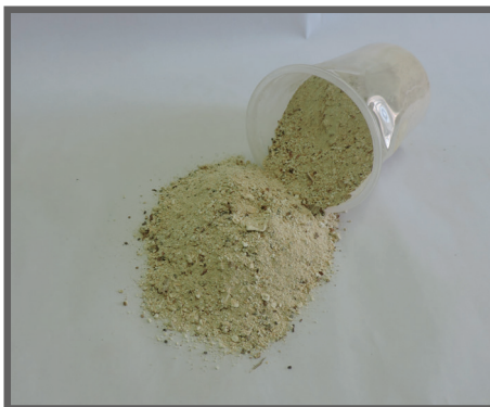
Figura 10 - Farinha integral de mandioca