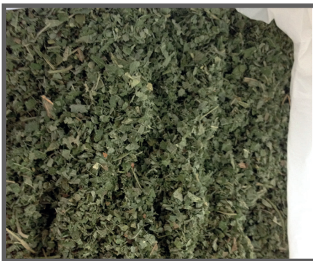
Figura 20 - Feno pronto para uso