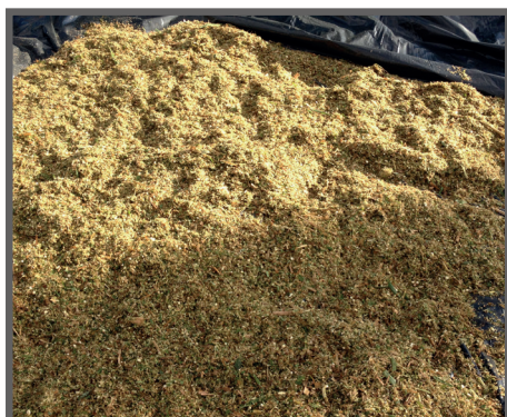
Figura 57 - Cana de açúcar triturada

Frutas: Geralmente são destinadas as que não possuem padrão comercial. Podem ser fornecidas in natura , contudo sempre eliminando o excesso, para que não apodreçam dentro da instalação e não se transformem em um foco de doença (figura 60).