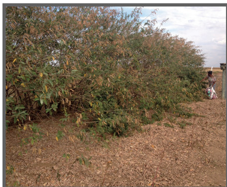
Figura 27 - Colheita Manual

Pesquisas apontam que a substituição do farelo de soja pelo feijão Guandu cru triturado (figura 30), em rações para frangos caipiras, pode ser feita em até 50%, não comprometendo o ganho de peso das aves. Desta forma podemos concluir que, apesar de apresentar alguns fatores antinutricionais, estes não chegam a inviabilizar a sua utilização.