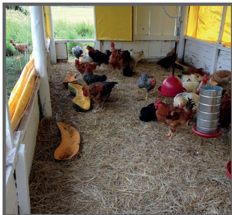
Figura 59 - Aves se alimentando de abóbora