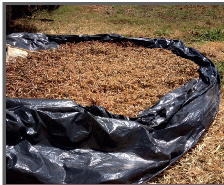
Figura 28 - Feijão secando ao sol