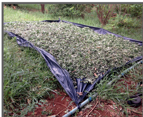
Figura 35 - Folhas secando a sombra