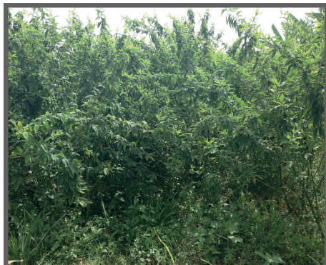
Figura 31 - Plantas em ponto de colheita