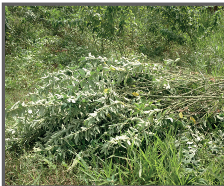
Figura 32 - Terço final da planta