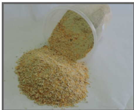
Figura 13 - Milho triturado- principal fonte de energia na dieta de aves

Existem outras formas de análise de custo mínimo de alimentos, como a utilização de programas computadorizados e o cálculo que leva em consideração toda a composição do alimento (energia; proteína; minerais; vitaminas) de forma simultânea, por isso a importância do produtor rural sempre buscar assistência técnica especializada, elevando, assim, a probabilidade de obter sucesso em seu empreendimento.