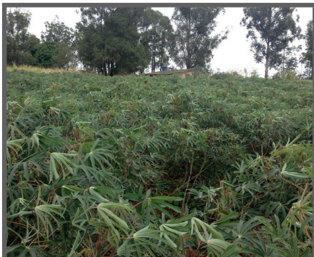
Figura 17 - Plantas com bastante folha