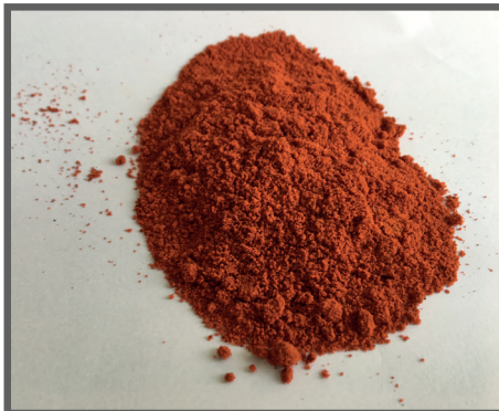
Figura 72 - Farinha de urucum