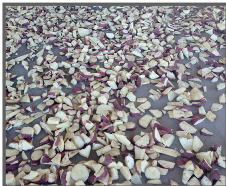
Figura 67 - Raspas de batata doce secando

Batata doce: É um produto rico em amido, contribuindo como fonte de energia para dieta. Pode ser fornecida in natura , contudo a melhor maneira de utiliza-la é na forma de farinha. O procedimento para obter a farinha de batata doce é idêntico ao da farinha integral de mandioca (figuras 67 e 68).