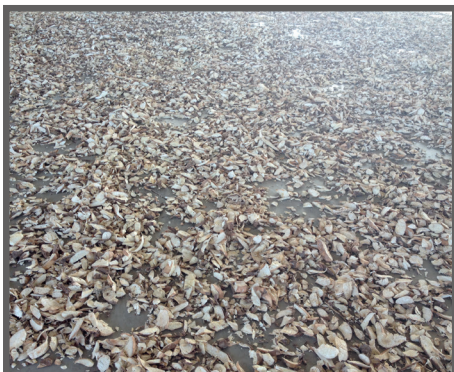
Figura 25 - Raspas no "ponto de giz"