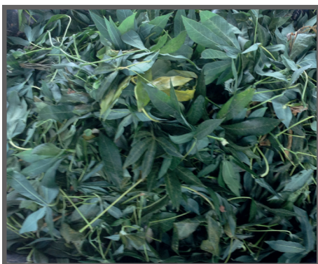
Figura 19 - Folhas secando à sombra