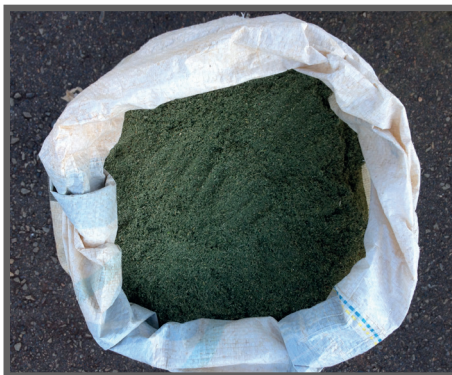
Figura 36 - Feno pronto para uso