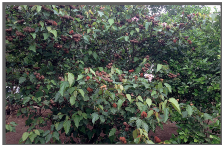
Figura 69 - Árvore de urucum

É importante ressaltar que a utilização do urucum, além das quantidades recomendadas, pode provocar queda no consumo voluntário da ração e por consequência redução na produtividade das aves, seja carne ou ovos.