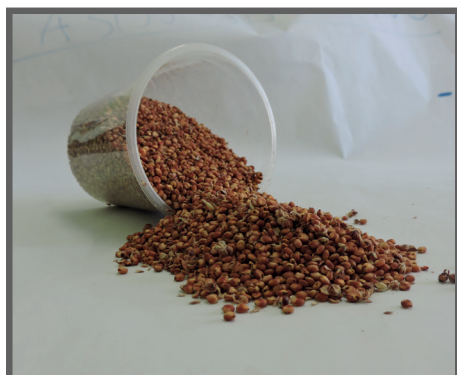
Figura 9 - Sorgo em grãos