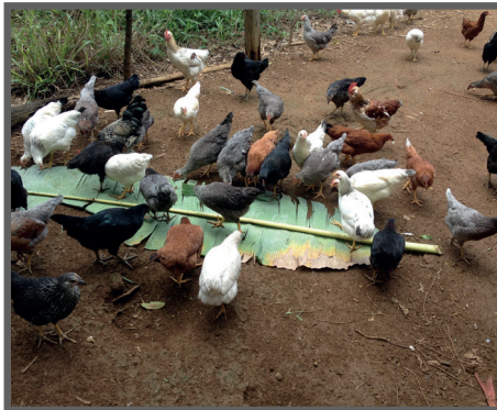
Figura 66 - Fornecimento de folha de bananeira