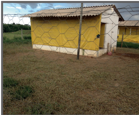
Figura 52 - Pastagem sem sistema rotacionado