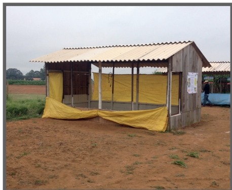
Figura 43 - Área antes do plantio

Com a análise pronta, basta realizar o preparo e a correção da fertilidade do solo (figuras 43 a 46), garantindo assim, o estabelecimento da planta forrageira de forma eficaz e duradoura.