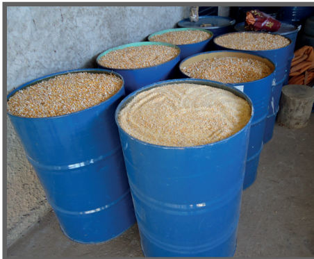
Figura 16 - Armazenamento de ração e insumos