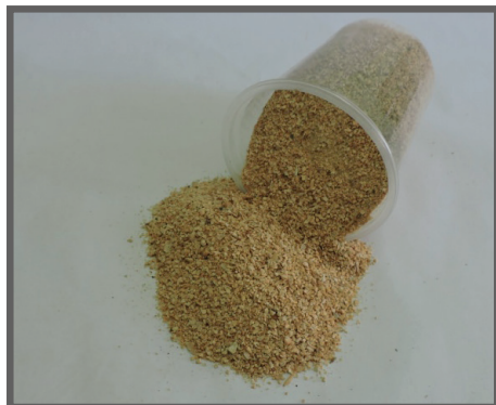
Figura 11 - Farelo de soja