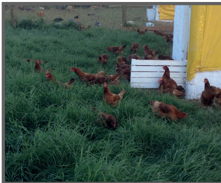
Figura 48 - Piquete com 1 dia de pastejo