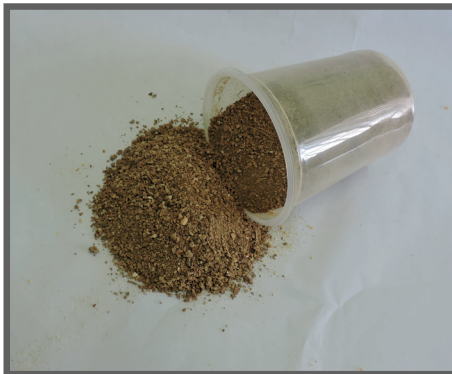
Figura 68 - Farinha de batata doce pronta