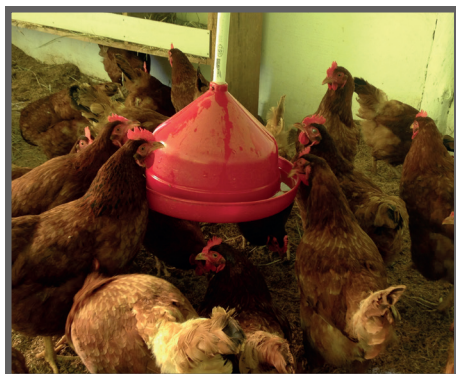
Figura 1 - Bebedouro tipo pendular

O produtor deverá atentar-se, também, à regulagem da altura destes bebedouros, que deverão ficar em torno de 5 cm acima do dorso das aves, evitando assim, que defequem na água ou que a derramem na cama do aviário.