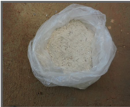
Figura 26 - Farinha pronta para uso