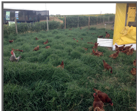
Figura 53 - Crescimento rasteiro (tifton)

de umidade, principalmente na época das chuvas, tornando-se foco de doenças. Além disso, árvores cujo seus frutos, possam atrair pássaros e insetos, devem ser evitadas, já que estes também podem ser vetores de doenças.