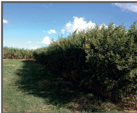
Figura 56 - Sombreamento com cerca viva