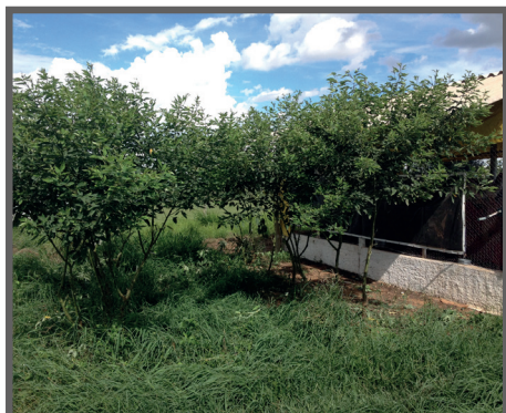
Figura 55 - Sombra no interior do piquete