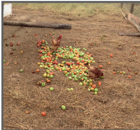
Figura 60 - Aves se alimentando de tomate

Hortaliças: Assim como no caso das frutas, são destinadas as sem padrão comercial. São fornecidas in natura . As mais comuns são as folhagens (figuras 61 e 62), como couve e alface. Um sistema muito disseminado atualmente é o “mandala”, que consiste no cultivo de hortaliças em volta do galpão das aves (figuras 63 e 64). Neste sistema a cama de frango produzida no galpão serve de adubo para o plantio das hortaliças, enquanto que as aparas e/ou as hortaliças sem padrão comercial são utilizadas para compor a dieta das aves.