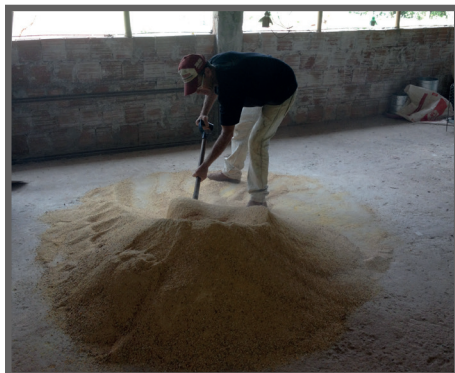
Figura 15- Mistura manual de ração

gredientes separados na dieta. Uma estratégia para quem vai realizar a mistura manualmente é adicionar os nutrientes que serão utilizados em menor quantidade (como é o caso do núcleo mineral e vitamínico) a uma pequena parte de um alimento que será utilizado em maior quantidade (como é o caso do milho). Desta forma o volume ficará maior, facilitando a homogeneização daqueles ingredientes com baixa inserção.