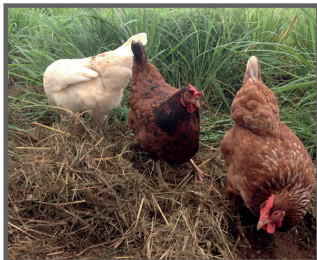
Figura 41 - Aves "ciscando e catando"