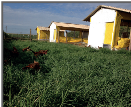
Figura 39 - Aves com acesso a pastagem

e conseqüentemente o risco com comportamentos indesejáveis como o canibalismo. Além disso, os pastos proporcionam melhor pigmentação da pele e da gema do ovo, características típicas de um produto genuinamente caipira.