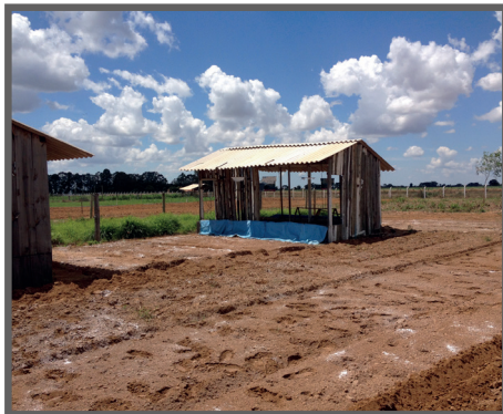
Figura 44 - Correção da acidez do solo