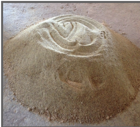
Figura 30 - Feijão Guandu triturado