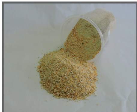
Figura 7 - Milho triturado