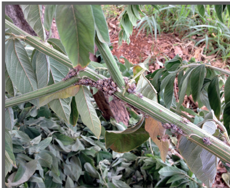
Figura 40 - Insetos no caule de Guandu