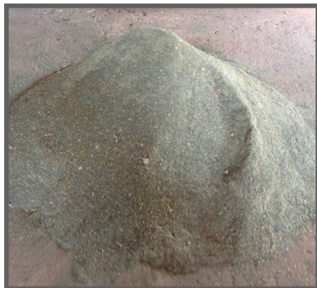
Figura 37 - Ração com o feno de Guandu