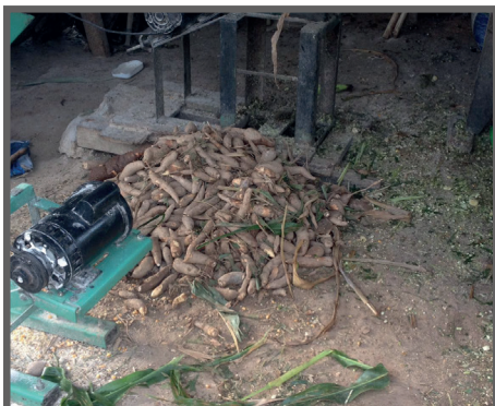
Figura 23 - Raízes sem padrão comercial