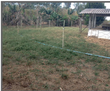
Figura 50 - Piquete com 5 dias de repouso