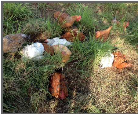
Figura 42 - Aves tomando "banho de sol"