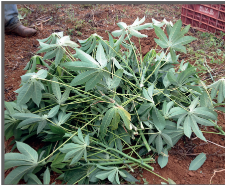
Figura 18 - Terço final da planta