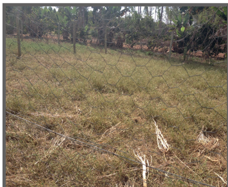
Figura 49 - Momento de retirar as aves do piquete