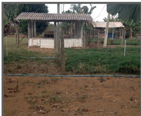
Figura 47 - Galpão com sistema rotacionado

É importante ressaltar que a adoção de um sistema rotacionado é uma técnica fundamental para a persistência do pasto na criação de aves caipiras, já que, neste sistema, é fornecido o tempo necessário para que a planta se restabeleça (figuras 47 a 52).