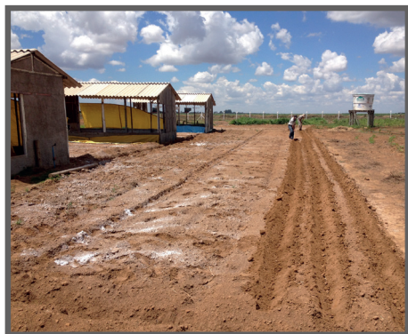
Figura 45 - Sulcos de plantio sendo abertos