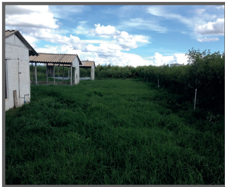
Figura 46 - Pastagem formada