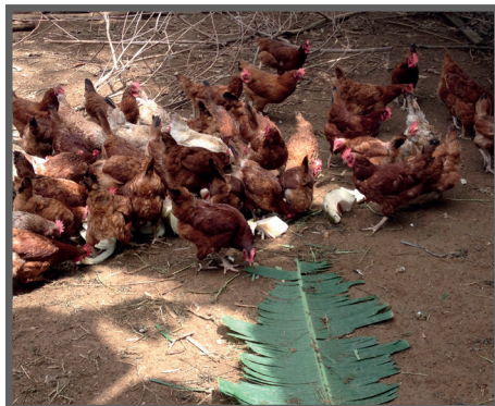
Figura 65 - Folhas e tronco de bananeira