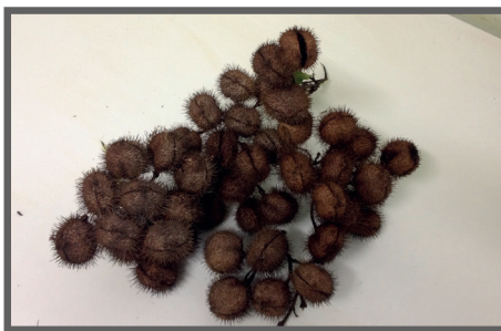
Figura 70 - Frutos do urucum