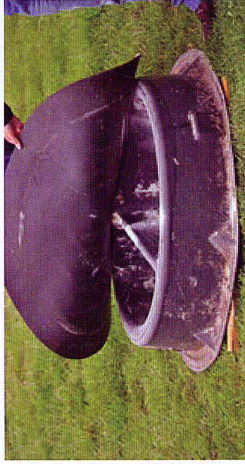
Cocho móvel protegido