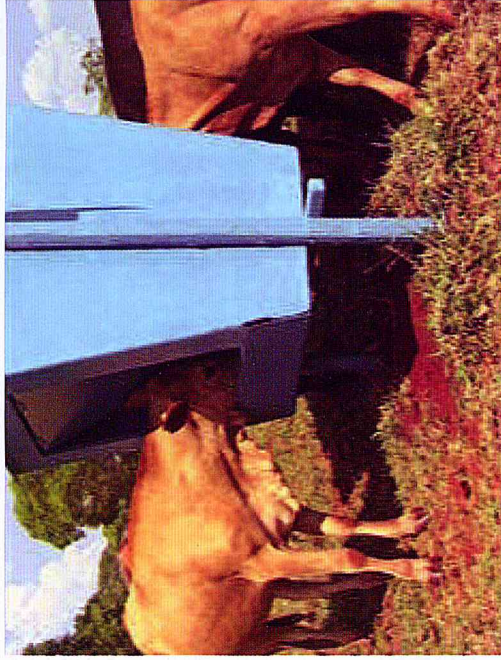
Cocho automático.