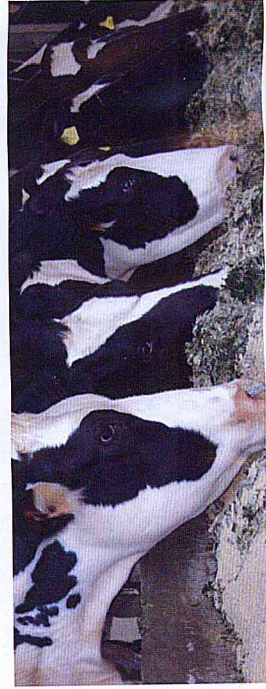
O sal deve ser específico para vacas leiteiras em lactação ou