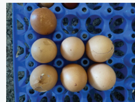
Figura 04. Ovos quebrados e impróprios para comercialização

12 Os ovos impróprios para consumo devem ser descartados. O descarte deve ser preferencialmente em composteira, pois se transformará em adubo orgânico podendo ser aproveitado no próprio piquete de gramíneas das aves.